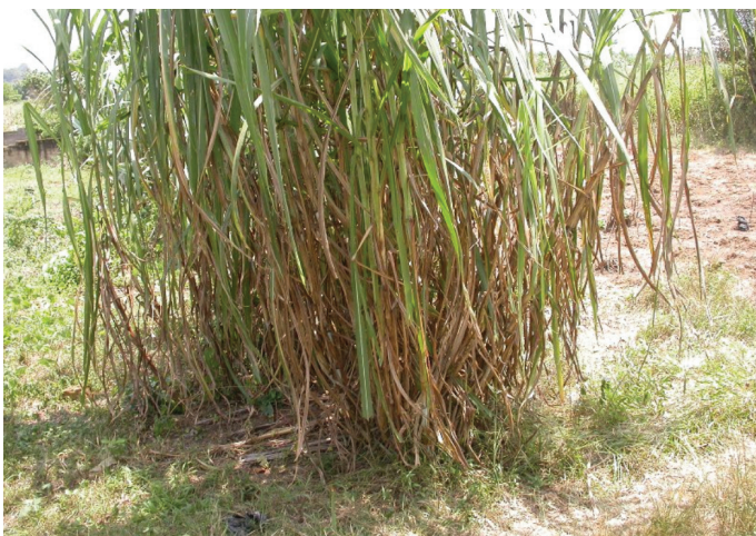
Figure 3: Aperçu du séchage à l'abri du fourrage vert sauvage de Pennisetum purpureum au contact avec l'air ambiant

Ces plantes herbacées occupent de grandes surfaces et cela facilite leur cueillette. P. maximum et P. purpureum se trouvent dans des milieux écologiquement différents. P. maximum se développe mieux sur la terre ferme ferrallitique alors que P. purpureum se rencontre principalement dans les zones marécageuses. Le cycle végétatif de ces plantes varie avec les saisons. Pennisetum purpureum est très