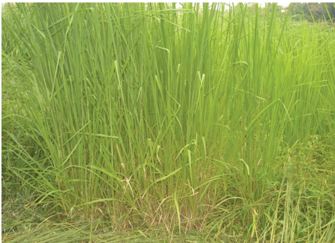
Figure 2: Aperçu de plantes fourragères tropicales de Panicum maximum en milieu naturel

et 1 678 mm par an (Avit et al. , 1999). Une grande saison des pluies s'étendant d'avril à juillet et une petite saison des pluies de septembre à novembre, entrecoupées par une saison sèche. La température reste élevée durant la saison sèche et peut dépasser, certains jours, 35°C. Durant les saisons pluvieuses, la température est relativement plus basse et oscille autour de 27°C. L'air est marqué par un fort taux d'humidité qui varie entre 96 % pour les saisons pluvieuses et 60 % ou seulement 50 % durant l'intersaison sèche. Le site comporte de nombreuses graminées fourragères qui constituent la banque fourragère naturelle, récoltée pour nourrir les animaux en élevage. Ce sont Panicum maximum , Jacq. (Herbes de Guinée) qui se desséchaient pendant la saison sèche (Figure 2) et Pennisetum purpureum , Schumach., (herbes à éléphant), plus résistante à la sécheresse (Figure 3).